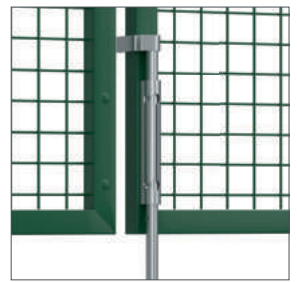
Grondgrendel en grondgrendelhouder voor dubbele draaiporten