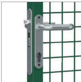
Inox inbouwslot met slotplaat en aluminium krukken