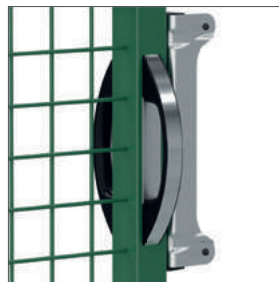
Aluminium handgreep voor dubbele draaiporten