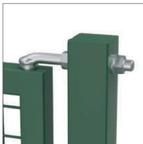
Stevige en makkelijk regelbare, vuurverzinkte M16 scharnieren