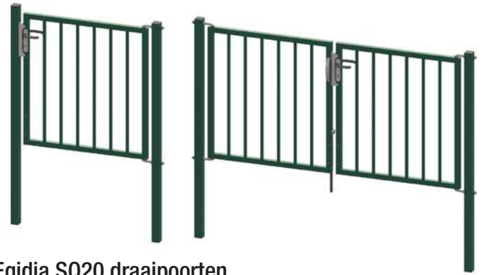
Egidia SQ20 draaipoorten

Betafence is wereldmarktleider in omheiningoplossingen, toegangscontrole en detectiesystemen voor perimeterbeveiliging. Alle Betafence bedrijfs- en productnamen zijn handelsmerken van PRÆSIDIAD Group Limited. Het assortiment en de producten kunnen worden gewijzigd zonder voorafgaande waarschuwing. Betafence is er trots op een PRÆSIDIAD-merk te zijn en maakt deel uit van een wereldwijd netwerk waarin het met Hesco samenwerkt als leider in perimeter beveiligingsystemen en -oplossingen. Meer informatie vindt u op praesidiad.com .