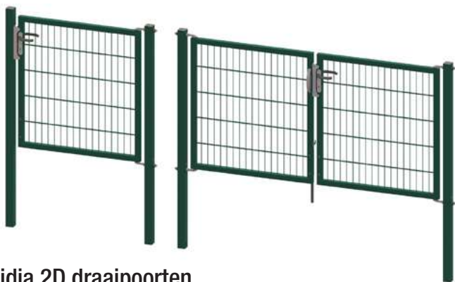
Egidia 2D draaipoorten